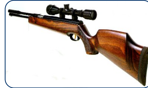
Poliisihallitus siviiliaseet ja -patruunat