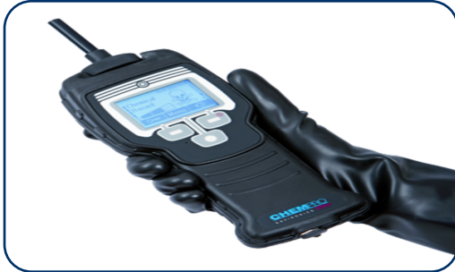
UM / TUO-30 kaksikäyttötuotteet