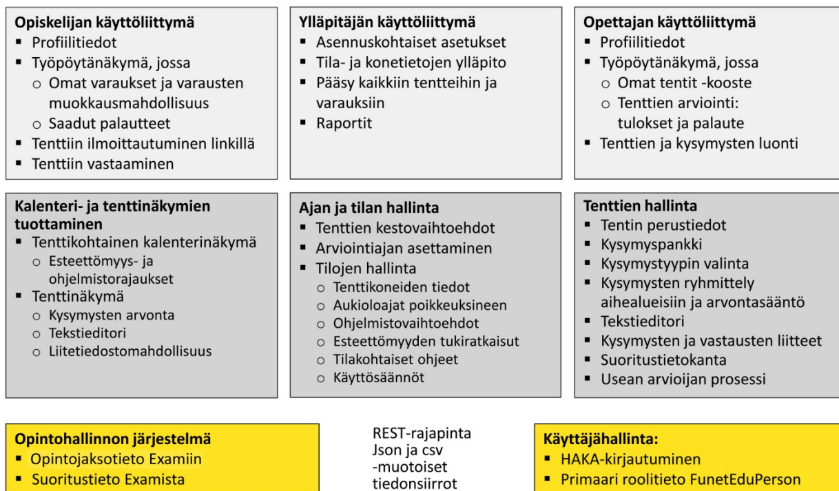
Kuva 1. Exam in tarjoamat toiminnallisuudet.

Exam in tarjoamat toiminnallisuudet yleisellä nimetään kuvassa 1 ja niiden väliset suhteet tenttiprosessin aikana kuvassa 2. Yksityiskohtaista tietoa käyttäjäroolien mukaisten palvelujen sisällöstä ja jatkokehitystavoitteista on palvelun wikisivustolla. 2